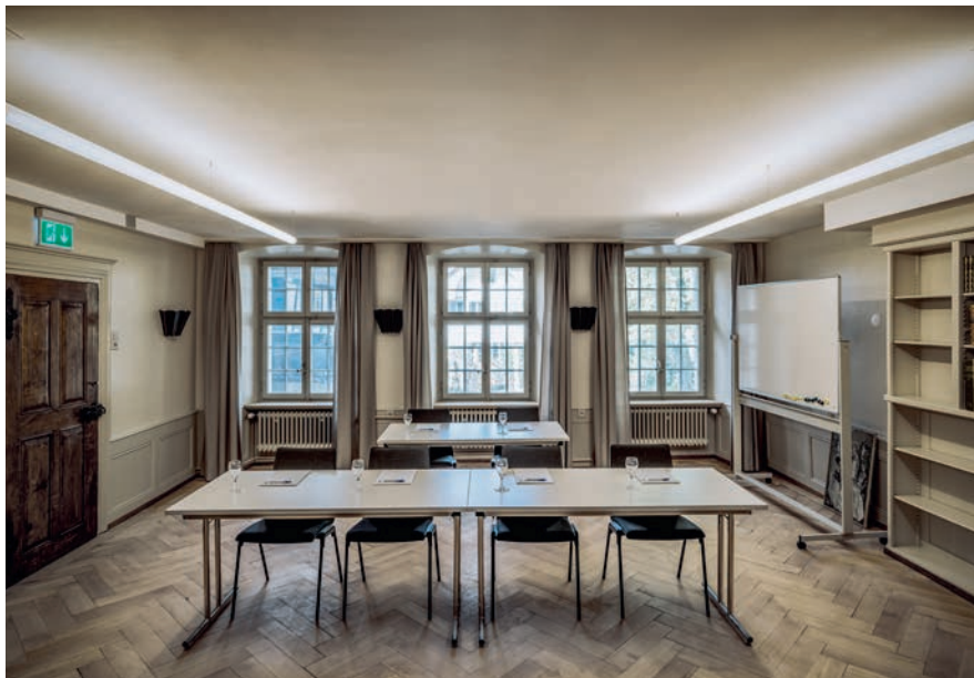
JucoJunior im Sitzungsraum eines historischen Gebäudes

Die JucoJunior ist erhältlich in Weisslicht, Dynamic White, RGB und RGBW. Die LED's werden von qualitativ hochwertigen