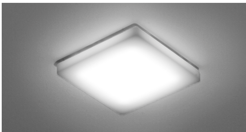
Decken- und Wandleuchte GENNO 148 mit 630 Lumen