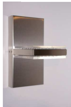
Muro D2 ↓